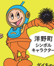
洋野町 シンボル キャラクター