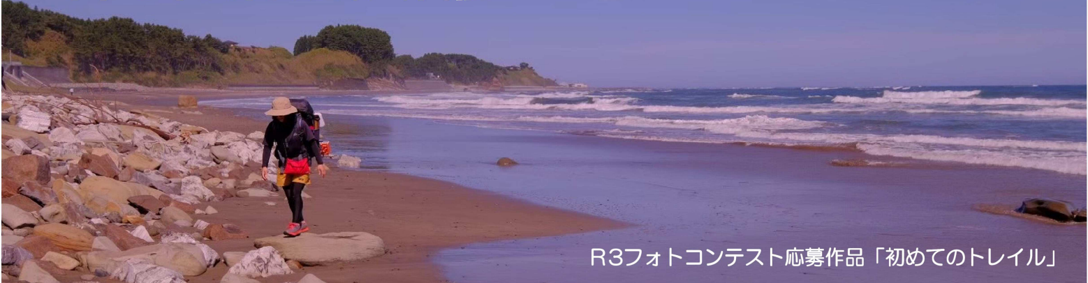
R3フォトコンテスト応募作品「初めてのトレイル」